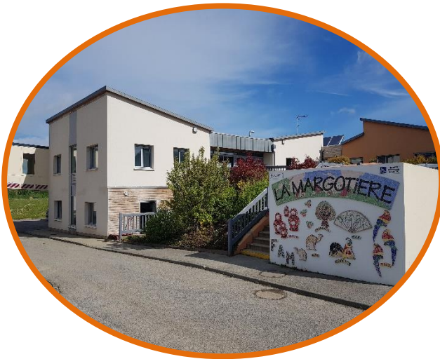
Le Foyer d'Accueil Médicalisé

Le pôle médicalisé de l'APEI de la région dieppoise se compose de 3 autres établissements sur le même site :