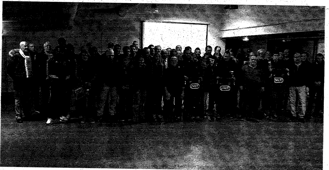
Depuis de nombreuses années, une soirée consolide le partenariat entre le FC Dieppe et l'ESAT avec des retombées positives pour les deux structures.